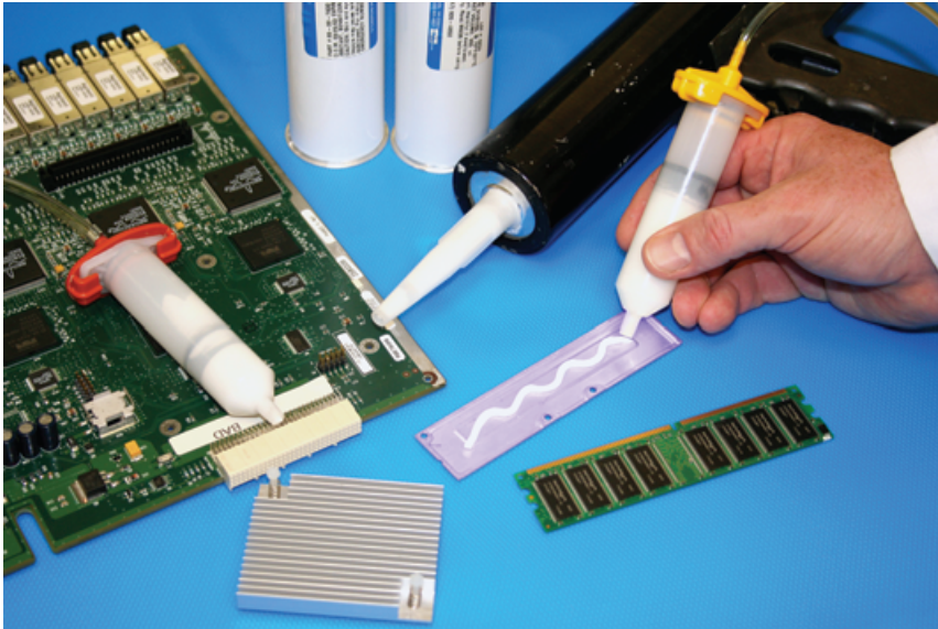
Applikation der Gapfill-Materialien T635 und T636