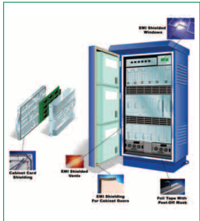
Abschirmung und Erdung für Schaltschränke im Freien

bei der Polymerentwicklung und bei der Kombination verschiedener Materialien brachten kosteneffiziente und leistungsfähige Abschirmdichtungen hervor, die zusätzlich verbaut werden können oder bestehende Produkte ersetzen.